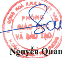
Nguyễn Quang Sáng